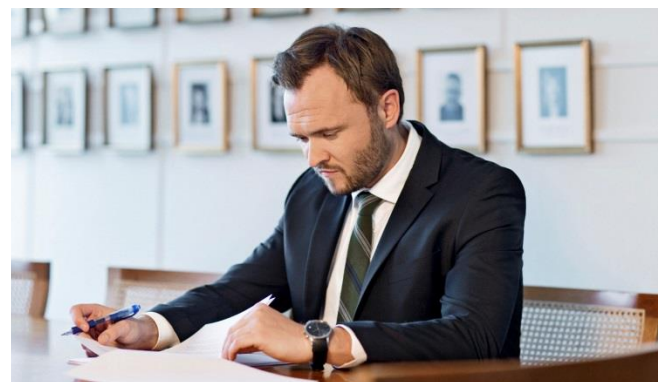
Dan Jørgensen Fødevareminister

Sammen skal vi gøre Danmark til Europas foretrukne destination for lyst- og fritidsfiskere.